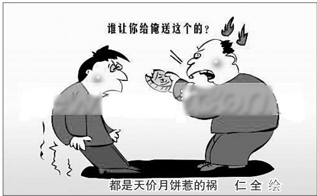
都是天价月饼惹的祸 仁全绘