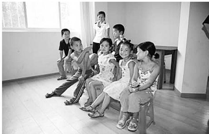
开心的孩子们在一起愉快交流