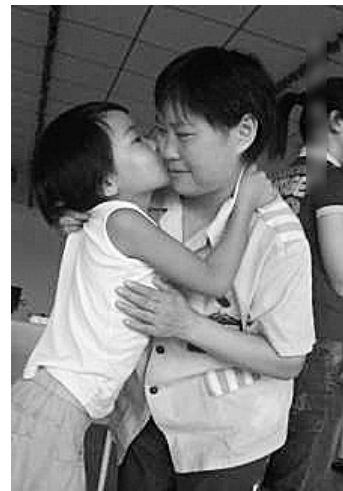
甜蜜的吻给最亲爱的母亲

调查显示,服刑人员未成年子女中3%在社会上流浪、乞讨,约1.2%服刑人员未成年子女有违法犯罪记录。更值得关注的是,这类孩子辍学现象严重,受教育权得不到保障。被调查的服刑人员中,其未成年子女在父母入狱后辍学的为82.43%。曾受到过社会救助的服刑