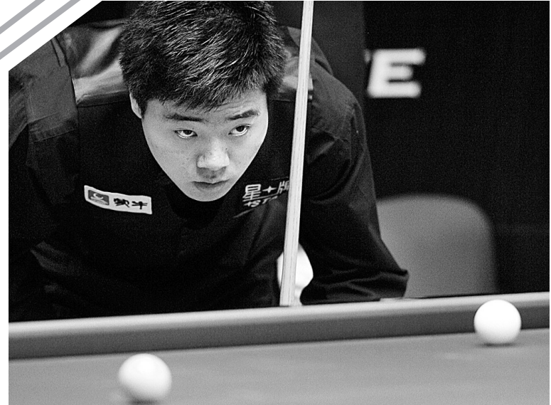
9月10日,中国选手丁俊晖在比赛中。当日,在2009斯诺克上海大师赛正赛第二轮比赛中,丁俊晖以5:2战胜英格兰选手斯图亚特·宾汉姆,晋级八强。