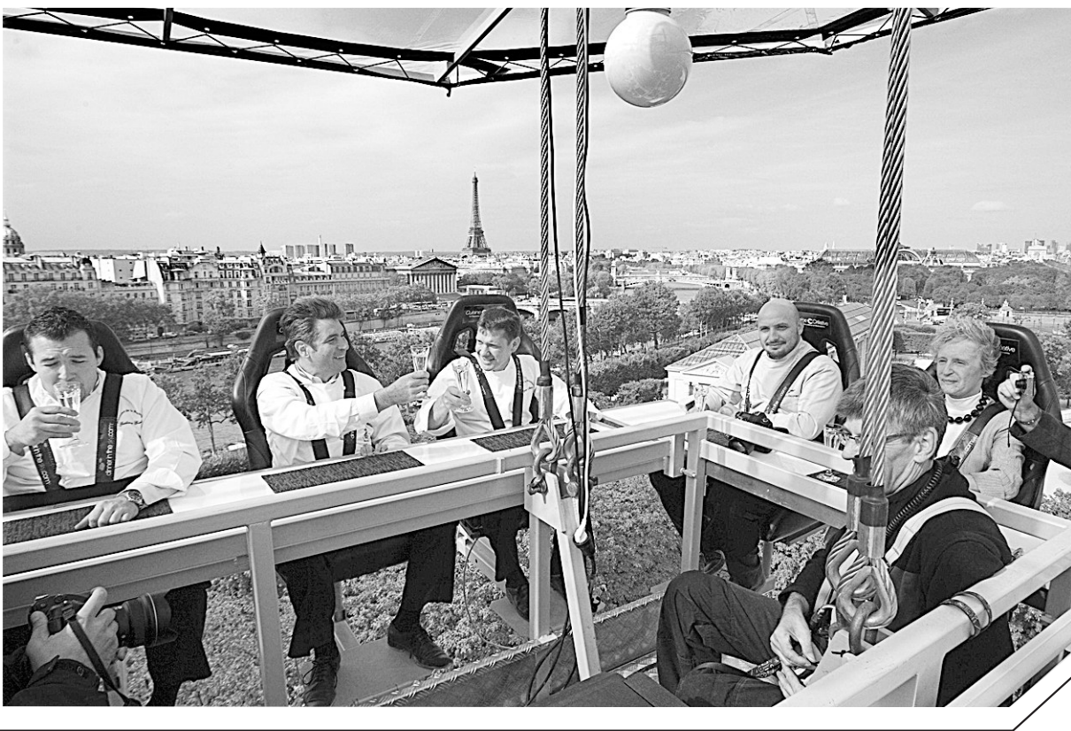
9月11日,在法国巴黎,厨师和媒体工作人员在“空中餐厅”上喝酒小憩。这个距离地面50米的“空中餐厅”活动由一家饮食杂志组织发起,每次可接待22人同时用餐,活动预计持续5天。