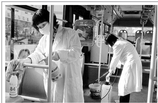
秋季是各类流感等传染病的多发期,为给市民 创造安全、卫生的乘车环境,从昨日 起,市公交二公司 开始对所属30余条公交线路的 700余辆公交车 进行大面积消毒。

该活动由邯郸市旅游 局、武安市旅游局联合 举办。据介绍,武安市位 于河北省北部,拥有晋冀 鲁豫中央局、军区司令 部、边区政府等丰富的 红色旅游资源。该市陶 阳沟村是著名戏剧家 杨兰春先生的家乡, 是戏剧《朝阳沟》 故事的创作原型地, 剧中主要人物拴保、 银环等都出生在这里。