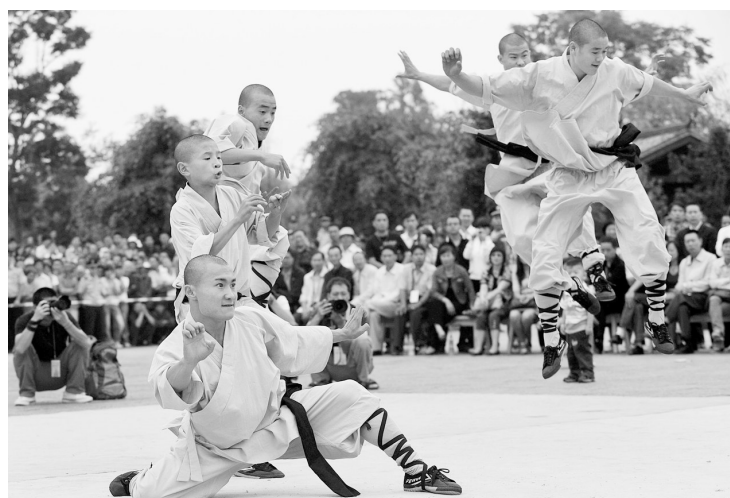
9月16日,云南昆明“官渡少林寺”正式挂牌,并免费向游客开放。 上图 少林武僧在云南昆明官渡古镇表演少林功夫。 右图 河南嵩山少林寺方丈释永信(右)参加“官渡少林寺”挂牌仪式。