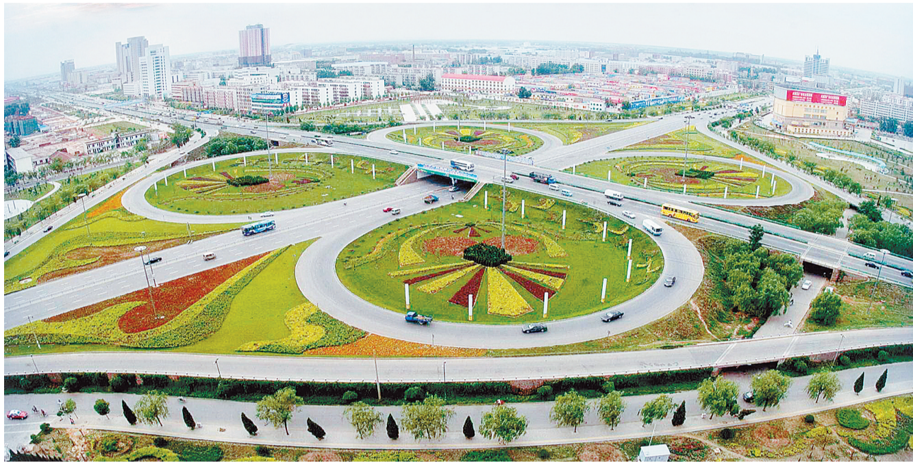
风景如画的花园路立交桥。

3600年前的商都,新中国成立后的河南省会,当今的中部城市群龙头——近几年来,郑州城市建设高标准、超常规、人性化的跨越式发展,为郑州赢得了难得的发展机遇,让郑州在中原城市群激烈的角逐中崭露头角,跃上城市的新高度。 解放之初的郑州市建成区面积仅5.2平方公里,唯一的标志性建筑就是二七塔,全市仅有77株行道树,市区没有一个公园和苗圃,城市东北和东南郊区因黄河决口留下了7.6万多亩沙荒地和400多