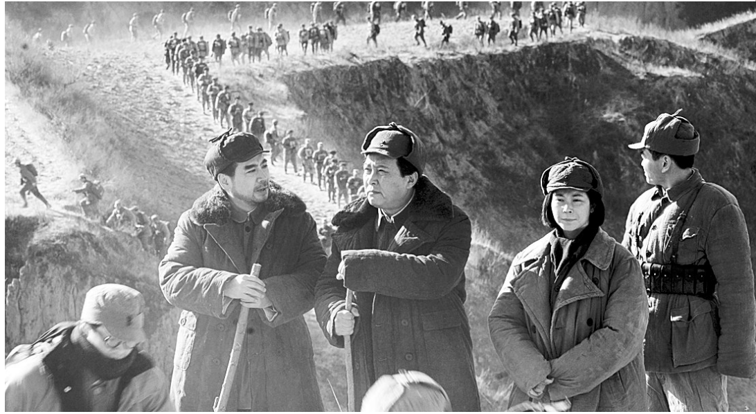
电影《建国大业》剧照

尽管没有涉及更多的战争，然而这是一场尖锐的政治较量：无情和有情，残酷和宽容，独裁