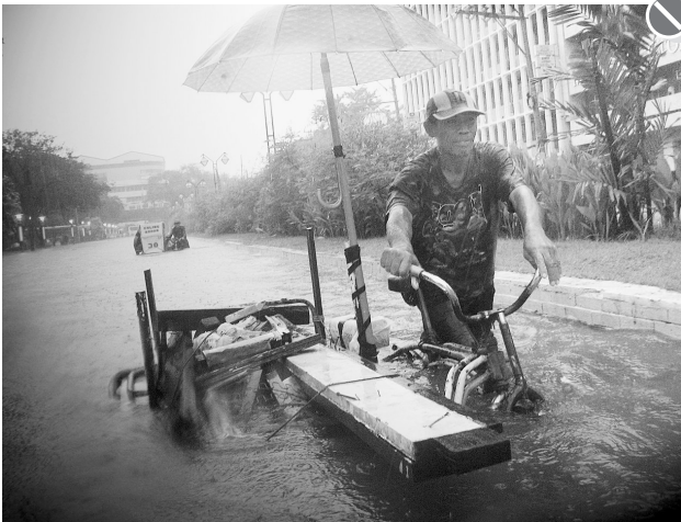
26日,在菲律宾首都马尼拉,一辆三轮车在积水的路面上艰难前行。台风“翁多伊”当日凌晨袭击菲律宾北部吕宋岛,受台风影响菲律宾首都大马尼拉地区许多地方暴雨成灾。