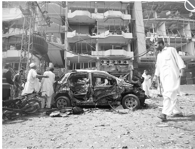
26日,巴基斯坦安全人员和救援人员在白沙瓦市发生汽车炸弹袭击事件的现场工作。巴基斯坦西北边境省首府白沙瓦市当日中午发生一起汽车炸弹袭击事件,目前已造成8人死亡,40多人受伤。