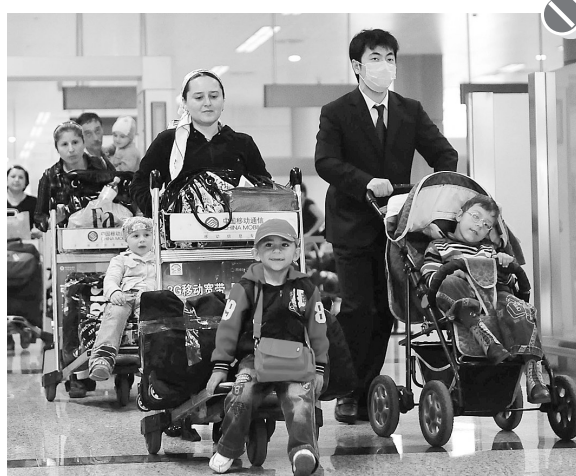
26日,脑瘫患儿在家长和机场工作人员的陪同下走出太原武宿机场。当日,30名来自俄罗斯的脑瘫患儿抵达太原,前往山西省脑瘫康复医院接受系统化治疗。这是2008年6月山西省脑瘫医院与俄方达成协议以来第三批前来治疗的患儿。

据新华社喀布尔9月26日电(记者林晶)阿富汗媒体26日报道说,阿独立选举委员会负责人纳杰菲证实,将在10日内公布8月20日总统选举的官方最终结果。纳杰菲说,选举委员会将在10日内公布总统选举的官方最终结果,以决定是否进行第二轮选举。如果最终,第二轮选举将在公布结果后的一个月举行。联合国主导的选举投诉委员会25日宣布其已随机选择了313个票箱的选票进行重计,目的是加速重新计票进程,以尽快得出官方最终结果。根据阿富汗独立选举委员会16日公布的初步完全计票结果,现任总统卡尔扎伊获得约309万张选票,得票率为54.6%。卡尔扎伊最大竞争对手阿卜杜拉获得约157万张选票,得票率为27.8%。若此结果被投诉委员会确定有效,卡尔扎伊将获得连任。此前,欧盟选举监督委员会在阿富汗首都喀布尔召开新闻发布会说,有150万张选票存在舞弊嫌疑。选举监督委员会说,150万张“可疑”选票中,至少110万张投给了卡尔扎伊,另外30万张投给了阿卜杜拉。根据阿选举法,若首轮投票中候选人得票率超过50%,那么该候选人将直接获胜,不用进行第二轮投票;否则将在首轮投票中得票前两位的候选人间进行第二轮投票。