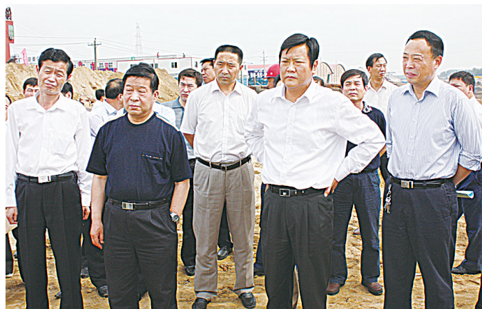
市委副书记、市长赵建斌视察生态水系建设

郑州市水利局在水土保持工作方针明确，重点突出，生态效益社会效益得到有效发挥。水土保持坚持“预防为主、全面规划、综合防治、因地制宜、加强管理、注重效益”的指导方针，共治理水土流失面积2417.43平方公里，重点项目建设卓有成效，邙山综合治理项目区呈现出“四季常青，三季有花，两季有果”的生态景观，已成为黄河岸边的一大水利胜境。