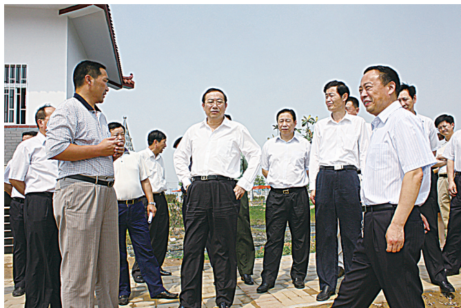
省委常委、市委书记王文超视察南水北调移民工作