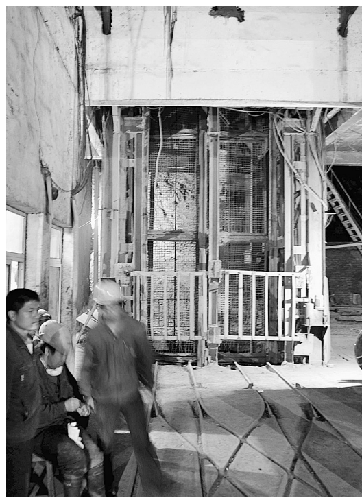
记者从湖南省政府获悉,10月8日9时15分许,湖南省冷水江市锡矿山闪星锡业有限责任公司南矿2直井运输矿工的罐笼因刹车失灵导致坠车,2个载有31名矿工的罐笼坠落。截至16时,事故已造成26人死亡(当场死亡19人,抢救无效死亡7人),5人受伤。图为事发矿井地面出口处(10月9日摄)。