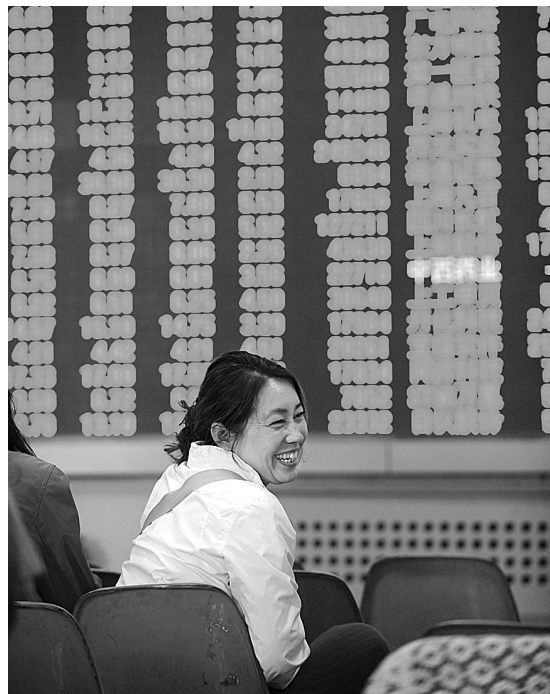
10月9日,在沈阳一家证券营业部,股民关注股市变化。

沪深300指数当日成功收复3100点,报3163.71点,涨158.90点,涨幅也达到了5.29%。10条行业系列指数全线飘红,除300电信外涨幅均超过了3%。300能源当日涨幅高达7.71%,300材料涨幅也达到了6.97%。 国庆长假期间,国际市场大宗商品价格大幅上涨,周四美国股市也在风险偏好的带动下走高,这对A股市场形成了带动,并令有色金属和能源板块直接受益。另一方面,9月和第三季度宏观经济数据即将出炉,对向好数据的预期也在很大程度上对A股形成了提振。在这一背景下,节后股市高开高走、强势上行。