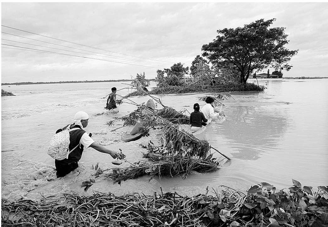
10月9日,在菲律宾首都马尼拉北部地区,当地居民涉水通过被淹没的公路。菲律宾官员9日称,菲律宾北部山区近日由于暴雨引起多处山体滑坡,造成至少90人死亡。