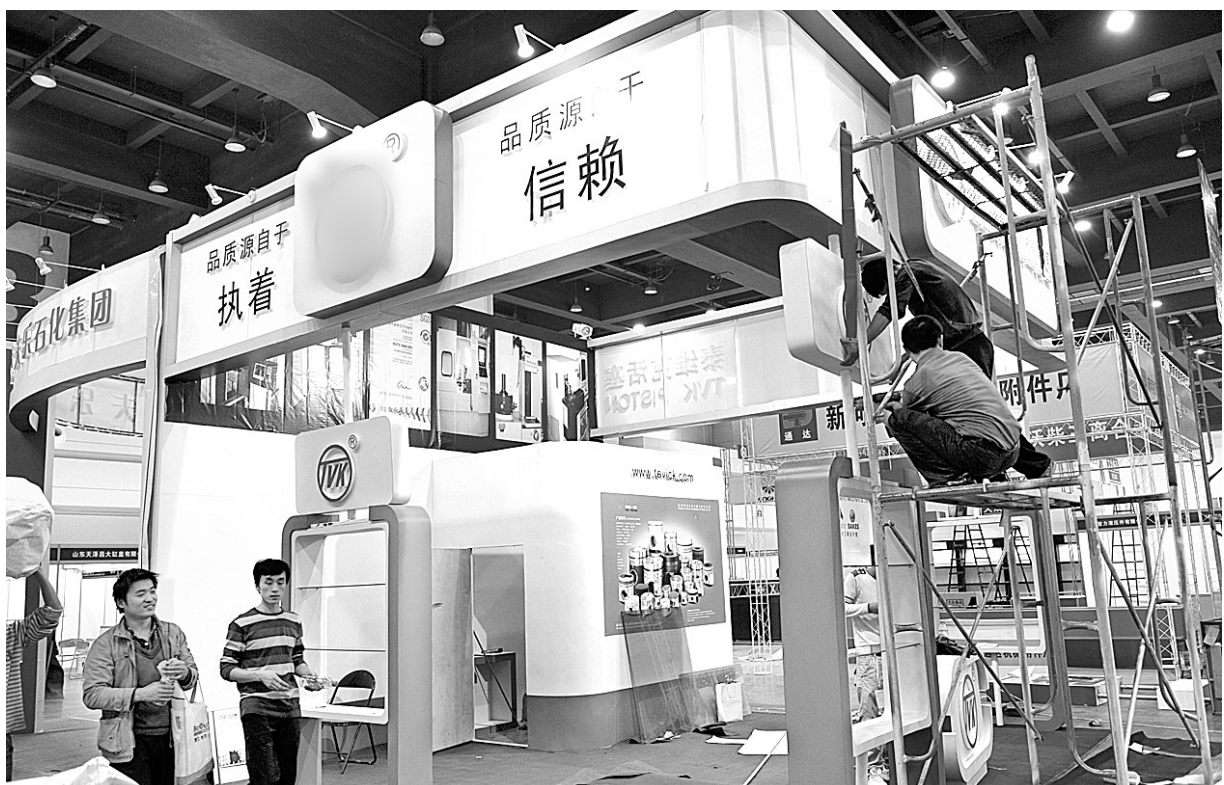
“第66届全国汽车配件交易会暨全国汽车配件采购交易会”将于10月22日至10月24日在郑州国际会展中心举行。目前,来自全国各地的厂商开始在场布置展区。

(上接第一版②)论坛上,与会专家进行了广泛的交流与对话,充分展示了国内外的最新科研成果,从多视角透析了河流治理及流域管理的经验模式,对维持河流健康生命的流域管理及科学研究等工作起到积极的推动作用。同时,黄河国际论坛出版的科技文献《黄河国际论坛文集》已被世界三大检索之一CPCI-S(原ISTP)全文收录,供世界各国从事流域管理及水利科学研究的学者、科技人员借鉴。 “黄河国际论坛”是以黄河为平台,增进国际水利学术交流与合作的大型国际研讨会,由黄河水利委员会倡导并主办。每两年举办一次,已经成功举办三届,旨在促进不同国家和地区间的沟通,交流河流治理经验,共同研究解决黄河问题及世界流域管理所面临的共性问题,实现人水和谐。