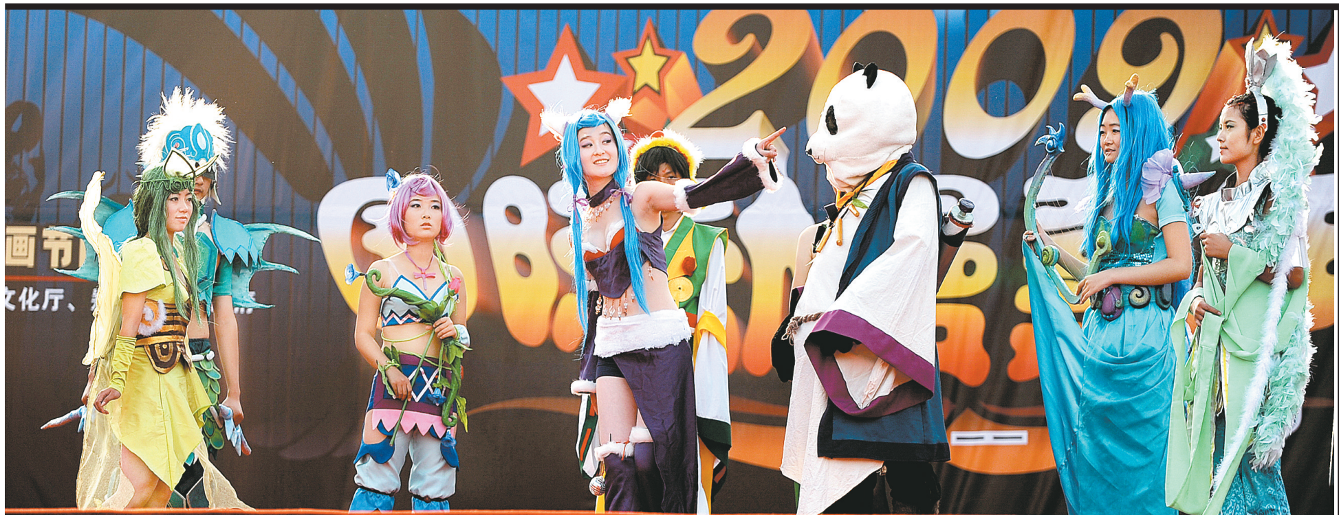
▲动漫迷们在表演网络游戏《大话西游3》的情景剧