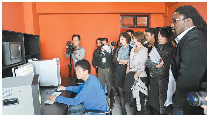
▲国内外动漫专家参观郑州动漫产业基地。