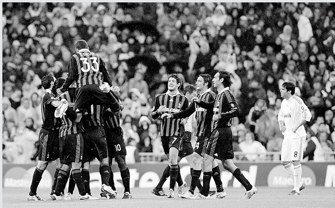
本赛季从AC米兰转会至皇家马德里的卡卡(右),无奈地看着AC米兰球员庆祝进球。