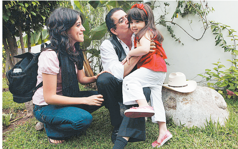
上图 10月25日,在洪都拉斯首都特古西加尔巴,洪都拉斯被罢免总统塞拉亚在巴西使馆内与女儿和外孙女在一起。