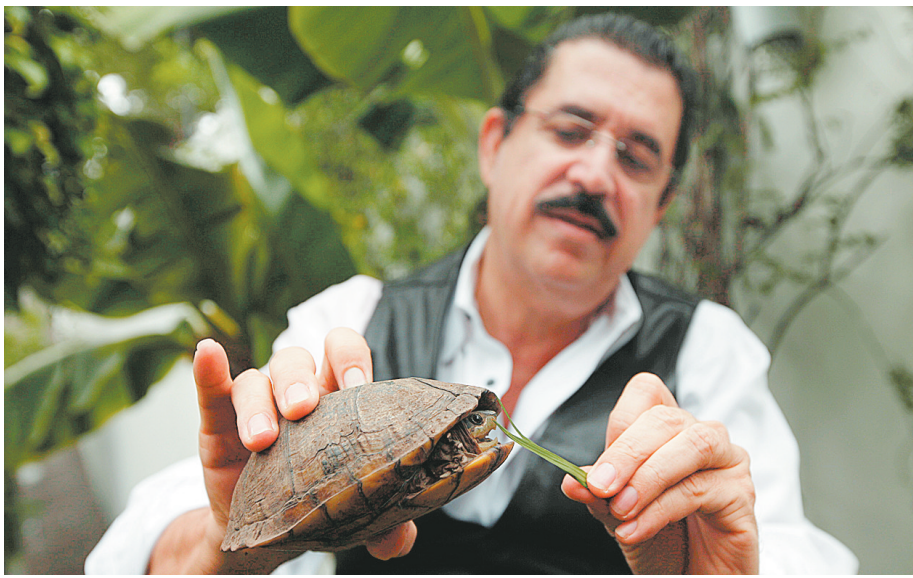
右图 10月25日,在洪都拉斯首都特古西加尔巴,洪都拉斯被罢免总统塞拉亚在巴西使馆内逗一只乌龟玩。