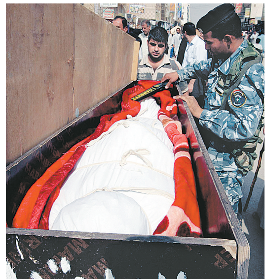
10月26日,在伊拉克首都巴格达以南160公里的纳杰夫,民众为25日巴格达爆炸袭击事件的遇难者举行葬礼。图为一名警察在葬礼前检查25日巴格达爆炸袭击事件遇难者的遗体。