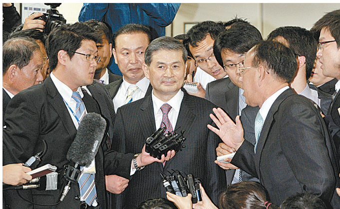
10月26日,在韩国首都首尔,韩国干细胞科学家黄禹锡(中)在听取记者提问。

当天,可容纳200多人的法庭旁听席完全坐满,100多名没来得及进入旁听席的“热心人”在法院前厅等候消息。开庭前约15分钟,黄禹锡身着黑色西装,一言不发地进入法庭。由于宣判时间较长,法庭允许被告坐下听候宣判。