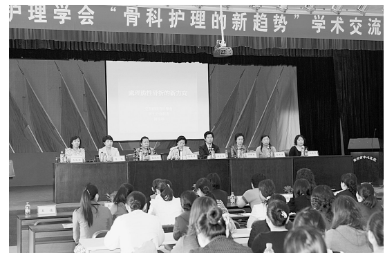
日前，由郑州市护理学会主办、市中心医院承办的“骨科护理的新趋势”学术交流会，在市中心医院举行。