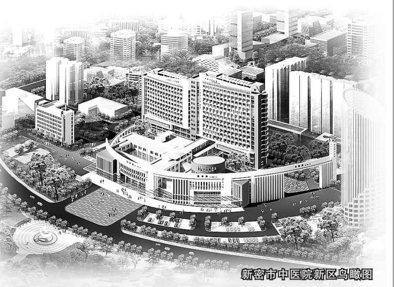
新密市中医院新区鸟瞰图

郑州市特色专科骨伤科、儿科、肿瘤、肛肠特色突出，声名远播；呼吸、心血管、妇科、烧伤等特色专科不断超越，“不逊风骚”；肿瘤内科、中医正骨、针灸、理疗、康复及中医肛肠病等专科独具魅力。