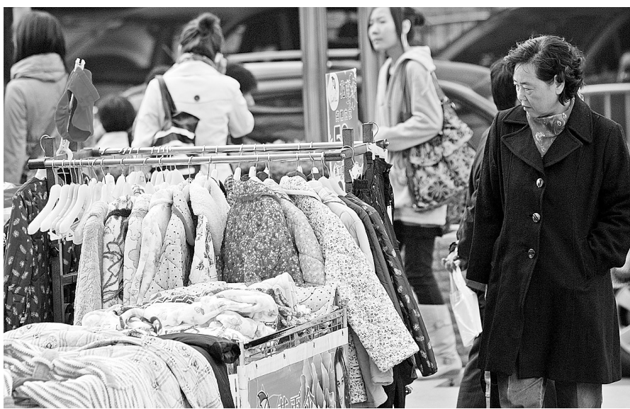
各大商场门前都摆出了卖保暖衣物的销售推车。

记者在金博大、郑州华联等商场看到,几乎所有商场都开始调整商品的位置,前几天还放在不起眼位置的棉衣,如今都被移到专柜主入口;在各大超市,御寒产品同样畅销;经三路一家超市促销人员告诉记者,厂家一款十元的棉拖鞋五折促销,3天内劲销2000多双,忙得工作人员都是手忙脚乱。此外,如今过冬御寒,羽绒服自然唱主角,记者在大多商场入口处都看到了“羽绒服特卖”等显眼字样。“一件今年新款的男士羽绒服只能打5折,而去年的旧款可以打2至3折,过了这几天,我们品牌的羽绒服就不会再打折了。”不少大品牌都在借机促销。