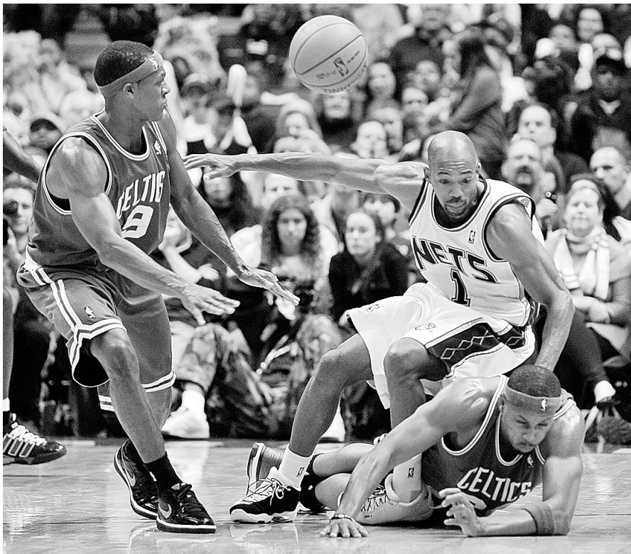
凯尔特人队球员皮尔斯(右下)与网队球员阿尔斯通拼抢。

在7日结束的其他几场比赛中,芝加哥公牛队主场93:90险胜夏洛特山猫队;密尔沃基雄鹿队102:87战胜纽约尼克斯队;犹他爵士队99:104不敌萨克拉门托国王队;洛杉矶快船队113:110战胜孟菲斯灰熊队。