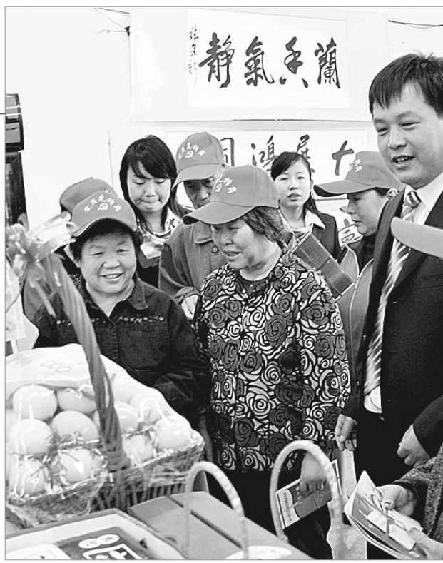
管城区东大街街道办事处城南路的“党员爱心超市”近日开业,在职党员购物凭“党员爱心购物卡”可享受优惠,购物消费额的3%留存“党员爱心互助基金”,用于对社区老党员、生活困难党员的帮扶救助。