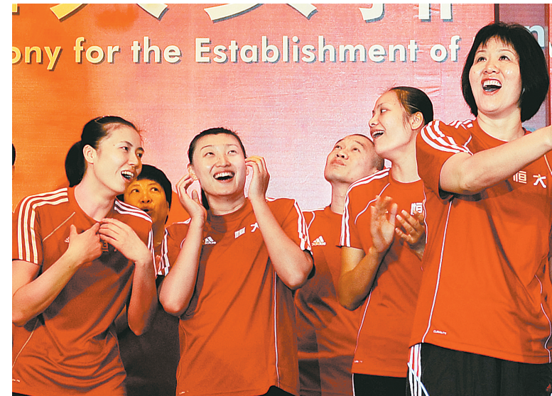
11月11日,广东恒大女排启动仪式在广州举行。由郎平担任主教练的恒大女排汇聚了包括冯坤、周苏红、杨昊等在内的黄金一代球员,她们将代表恒大出征新赛季全国女排B联赛。图为郎平(右一)与周苏红(左一)、杨昊(前左二)等球员在启动仪式上。

“没有永远的朋友,只有永远的利益。”听起来显得薄情寡义,但有时,这句话却能恰如其分地反映出一些事件的客观性。正如最近闹得沸沸扬扬的有关刘炜与“姚之队”在新赛季CBA薪金谈判问题上陷入僵局这件事,有人直接把矛头指向了上海男篮的老板姚明,说他不顾兄弟情面,要“逼”走刘炜。但笔者认为,姚明和他的“姚之队”并非无情无义,运作一支球队本身就是一桩生意,而这与兄弟之间的情谊一点关系也没有。 当初,姚明收购他的母队上海男篮之时,有多少人对他的行为拍手称快,说他发家不忘本,但