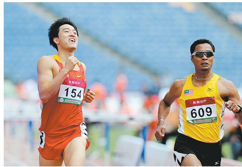
刘翔(左)轻松冲过终点线,身后是一片空旷的看台。

文垚在最后阶段挑起劫争以求一搏,无奈劫材不够,败下阵来。行至第246手,朴文垚投子认输。 34岁的李昌镐曾经是无可争议的世界围棋第一人,总共夺得过17个世界冠军头衔。然而,自2005年3月在第五届春兰杯赛中登顶之后,李昌镐再也没有品尝过世界冠军的滋味,连续八次获得亚军。究竟是孔杰超越自我,还是李昌镐打破魔咒,2010年2月的LG杯三番棋决赛将揭开谜底。