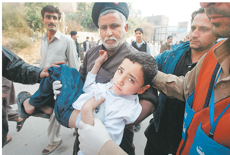
11月16日,在巴基斯坦西北边境省首府白沙瓦,人们将一个在爆炸中受伤的男孩送往医院。

据新华社巴基斯坦白沙瓦11月16日电 巴基斯坦西北边境省首府白沙瓦一所警察局附近16日上午遭到自杀式汽车炸弹袭击,造成至少6人死亡,20人受伤。