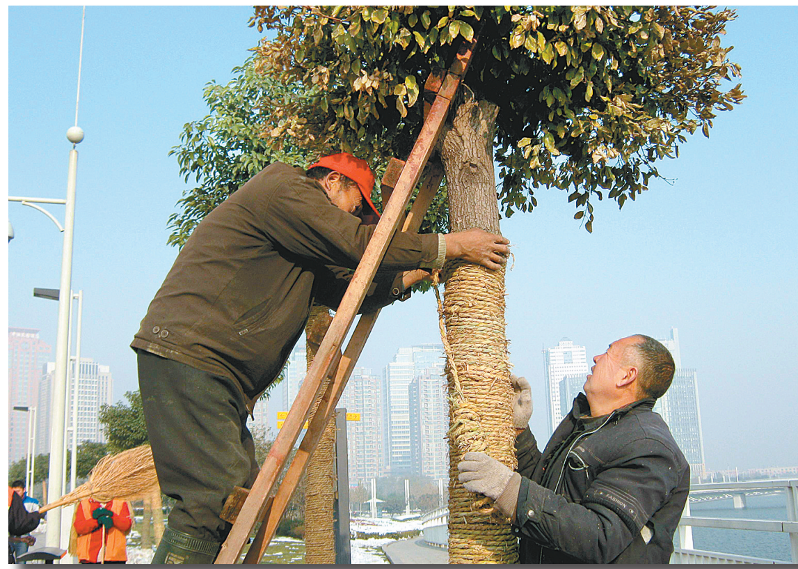
郑东新区新种了许多行道树,为确保这些树木安全过冬,截至昨日,他们已给辖区的数百棵行道树穿上“防寒服”。图为工人正在给一棵香樟树身上缠绕稻草绳。

张恩茂告诉记者,他关注《红楼梦》的版本更基于这本书内容本身。“收藏这些书,我觉得特别高兴,特有成就感。”