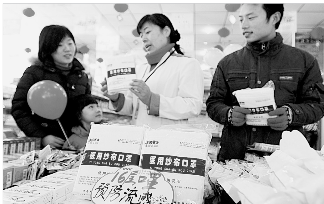
冬季是流行性感冒的高发期,许多市民选择戴口罩来预防流感,郑州一些大药房推出了16层无菌口罩,市民争相购买。

11月21日,山东省平阴县安城乡在济南市泉城广场举办“鲜食甘薯文化节”,向济南市民介绍地瓜的营养保健作用,并请大家免费品尝特色地瓜。平阴县安城乡近年来引进培育了五彩地瓜、食叶地瓜、富硒地瓜等新品种,产品销售到北京、黑龙江、天津等地,受到消费者青睐。