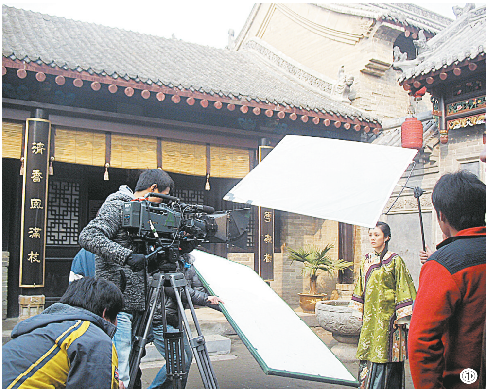
①拍摄现场。 ②群众演员参与拍康家“分家戏”。

《康百万》电视剧拍戏正酣,剧组每天都有怎样的生活?拍戏的背后都有哪些让人难忘的经历?昨日,记者走进《康百万》剧组,体验剧组拍戏的一天生活。