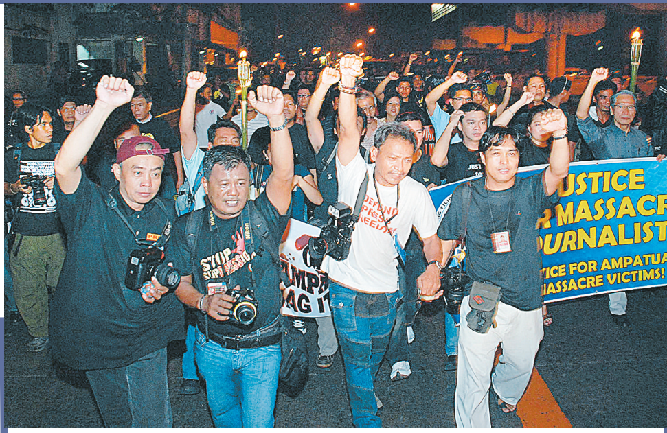
11月24日，菲律宾记者在马尼拉举行集会，抗议菲南部的绑架和屠杀事件。据美联社报道，57名死者中包括至少25名记者，如果他们的身份确认无误，这将是历史上对记者最大规模的一次集体屠杀。

害者中，男性35名，女性22名。同一天，菲律宾总统阿罗约宣布26日为全国哀悼日，以悼念绑架和屠杀事件中的死难者。