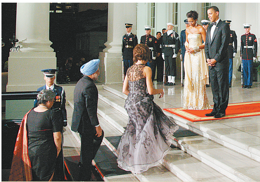
左图 24日，在白宫，美国总统奥巴马(前右一)和第一夫人米歇尔·奥巴马(前右二)迎接印度总理辛格(前左二)和印度总理夫人古尔沙兰·考尔(前左一)。当日，奥巴马在南草坪为辛格举办了国宴，这也是奥巴马在这里举办的上任以来的首次国宴。