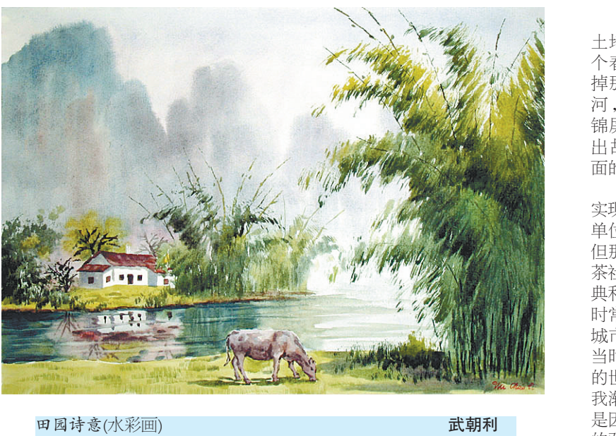
田园诗意(水彩画) 武朝利