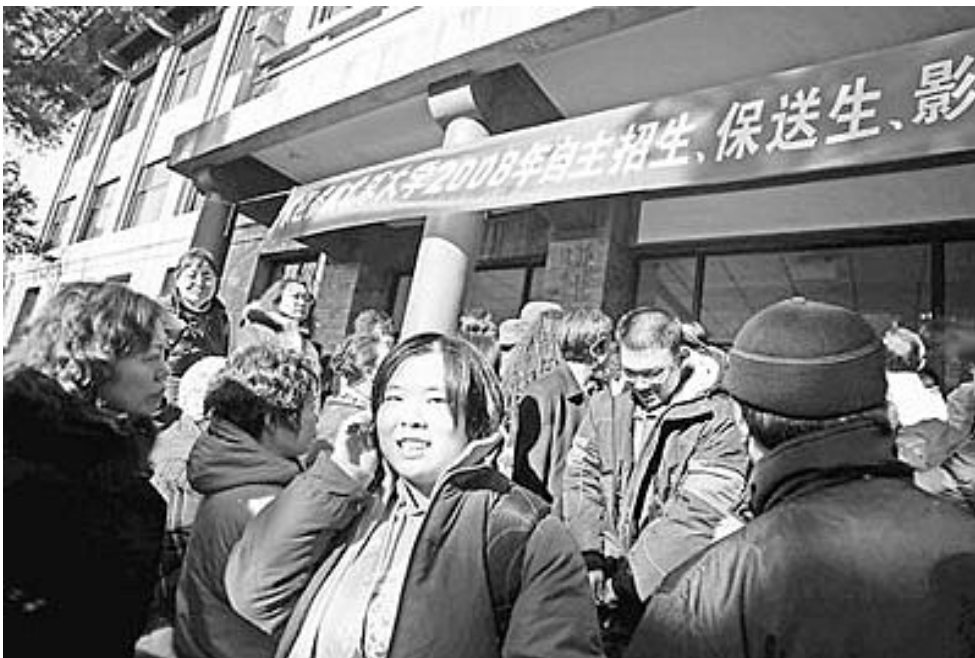
清华、北大自主招生笔试开考。

公众怎么看待自主招生？调查中，54.5%的人认为自主招生增加了高校的自主权；51.4%的人认为有利于选拔创新型人才；44.12%的人认为有利于综合素质优秀的学生脱颖而出；34.25%的人还是避免应试倾向；27.40%的人加重考生家庭负担和高考社会成本；27.44%的人认为到指定地点应考，费时、费力、费钱；22.63%的人认为“一考为多考，折腾”。