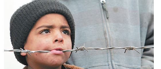
12月1日,在阿富汗首都喀布尔一处贫民区,两名儿童等待领取联合国难民署发放的援助品。联合国难民署近日开始向阿富汗约20万生活困难者提供木炭等非食品援助,以应对严酷的冬天。