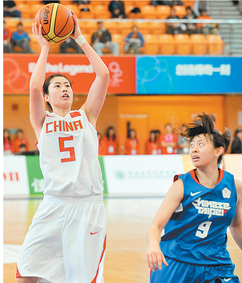
第五届东亚运动会将于5日在香港开幕。目前,部分比赛已经开始先期进行。