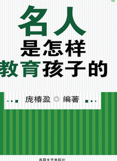
名人是怎样教育孩子的