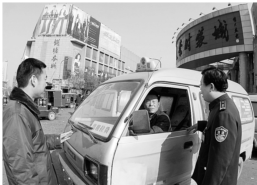
昨日,执法人员对占道经营车辆进行疏导。

本报讯(记者 靳刚)昨日本报对火车站附近的荣发街到锦荣商厦城门口的小商贩占道经营情况进行了报道。当