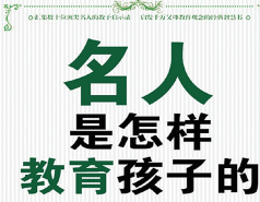
名人是怎样教育孩子的

李嘉诚深知这两个人绝对不会退给他。就告诉他们不要掘地三尺，他另找卖家。这次买地葬父的一番周折，深深地留在了李嘉诚的记忆深处，使他不仅上了一堂关于人生、关于社会真实面目的教育课，而且对于即将走上社会，独自创业的李嘉诚来说，也是面临在道义和金钱面前如何抉择的第一道难题。这促使李嘉诚下定决心，不管将来创业的道路如何险恶，不管将来生活的情形如何艰难，一定要做到：在生意上不能坑害人，在生活上乐于助人，做正直的人。