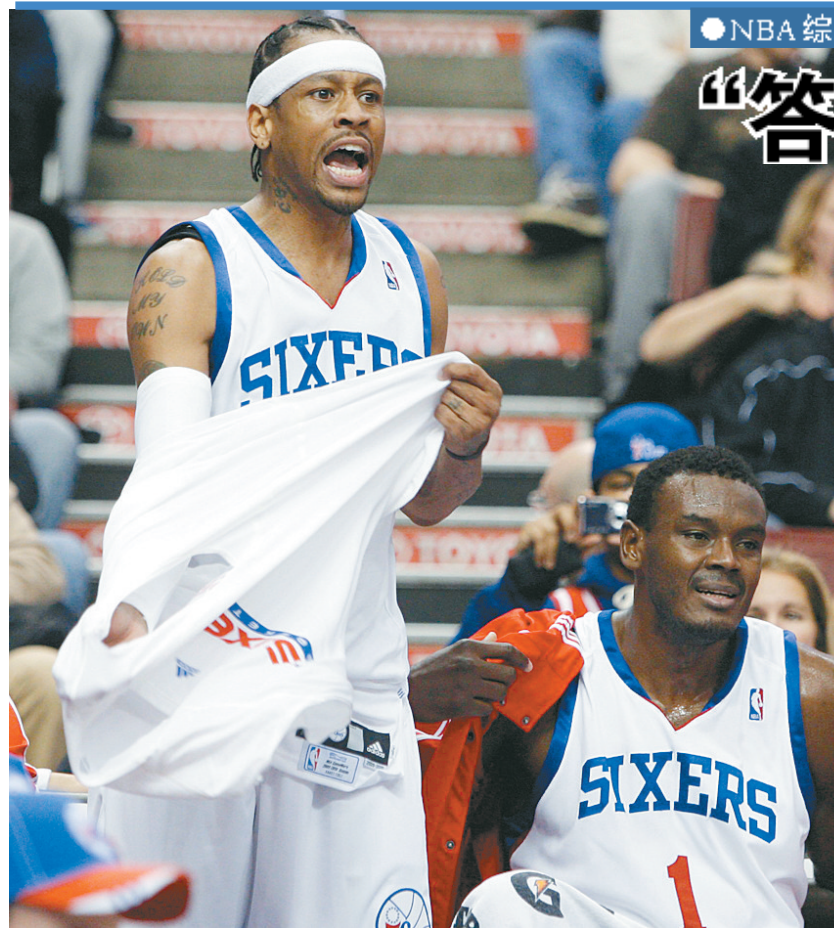
艾弗森(左)在场边休息时关注比赛。

影片采用了开放式的结局,聂风脱去魔性,步惊云为救聂风跌落悬崖,反角绝心尚在为江湖……这样的结局令人浮想联翩,看来导演是有意拍摄第三集。