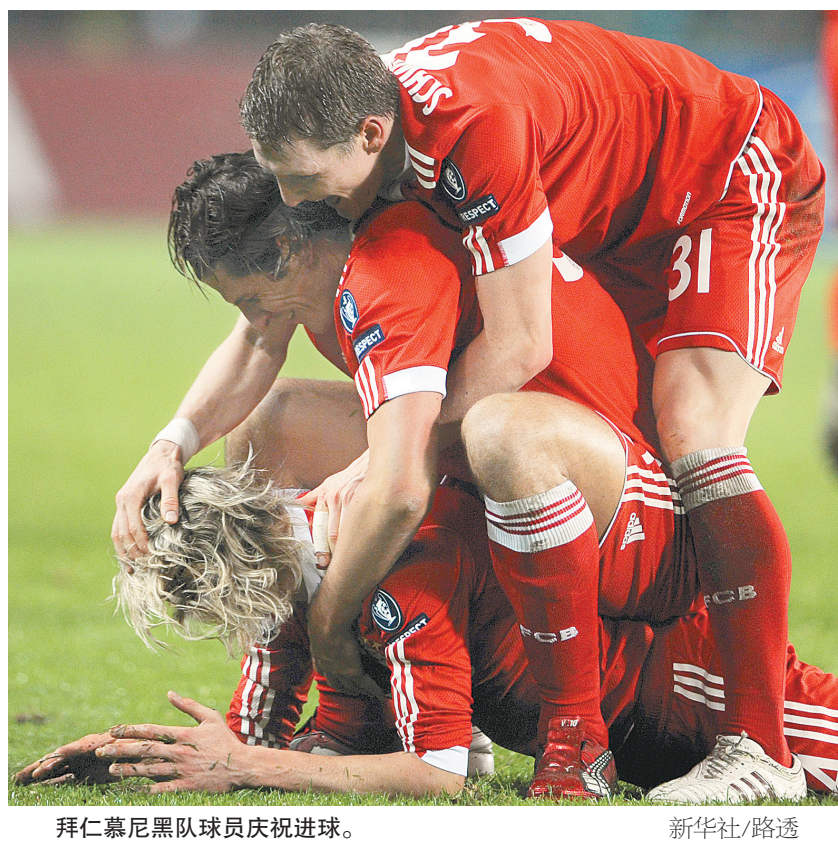
拜仁慕尼黑队球员庆祝进球。