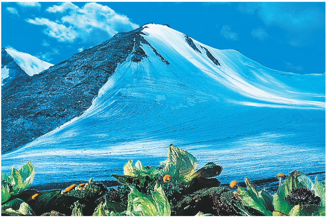
高原蓝梦

峰高人罕至，林密隔红尘。翠鸟鸣啾啾，黄叶落纷纷。天空日影碎，地上积腐深。山菊任采撷，野兔不伤人。