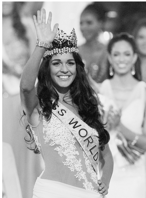
12月12日,在南非约翰内斯堡,直布罗陀小姐卡伊恩·阿尔多里尼奥当选2009年世界小姐。2009年世界小姐总决赛12日晚在南非最大城市约翰内斯堡举行,22岁直布罗陀小姐卡伊恩·阿尔多里尼奥艳压群芳,摘得世界小姐桂冠。

最体现“香港模式”之精髓的要数“水陆两栖”的开幕式。如果走常规路线,本届东亚运开幕式只能在可容纳4万人的香港大球场举行,纵有再多亮点也注定会淹没在众多规格更高、影响力更强的综合性运动会开幕典礼之中。