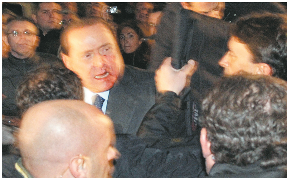
12月13日,在意大利米兰大教堂广场,面带血迹的意大利总理贝卢斯科尼在人们的簇拥下离开政治集会现场。

图工作。他先前没有任何刑事犯罪记录,但曾在当地医院接受过10年精神疾病治疗。警方眼下已要求塔塔利亚的主治医生前往警局,协助调查。