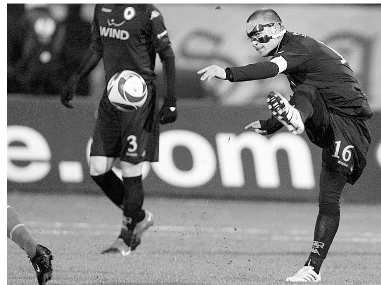
12月16日,罗马队球员罗西在比赛中射门。当日,在欧罗巴联赛小组赛E组比赛中,罗马队客场以3:0战胜索菲亚中央陆军队。