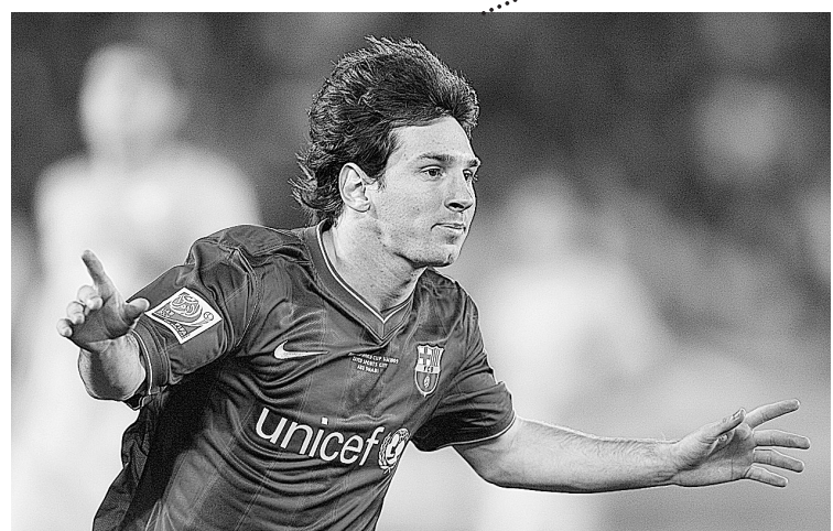
12月16日,巴塞罗那队球员梅西庆祝进球。当日,在阿拉巴比进行的世界俱乐部杯半决赛中,巴塞罗那队以3:1战胜墨西哥亚特兰特队,进入决赛。新华社发