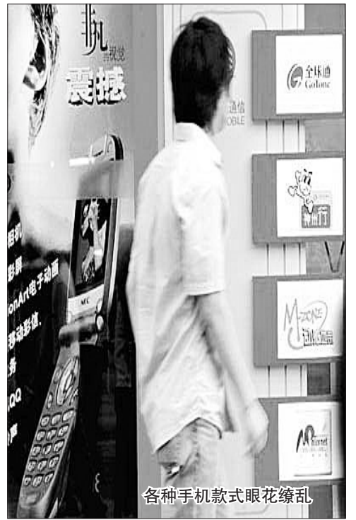
各种手机款式眼花缭乱