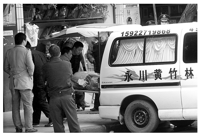
工作人员正在将受害者尸体运走。

21日上午10时许，重庆市永川区胜利路街道一居民点发生一起劫持人质案。该歹徒入室杀人后将被害人遗体从二楼抛出，又将一孕妇劫持作人质，警方在劝告无效后将其击毙。孕妇安全获救，目前母子平安。据悉，歹徒名叫刘勇，今年26岁，据邻居反映，此人为吸毒人员。被害人名叫陈强，24岁，重庆市铜梁县人，在永川万寿镇打工。