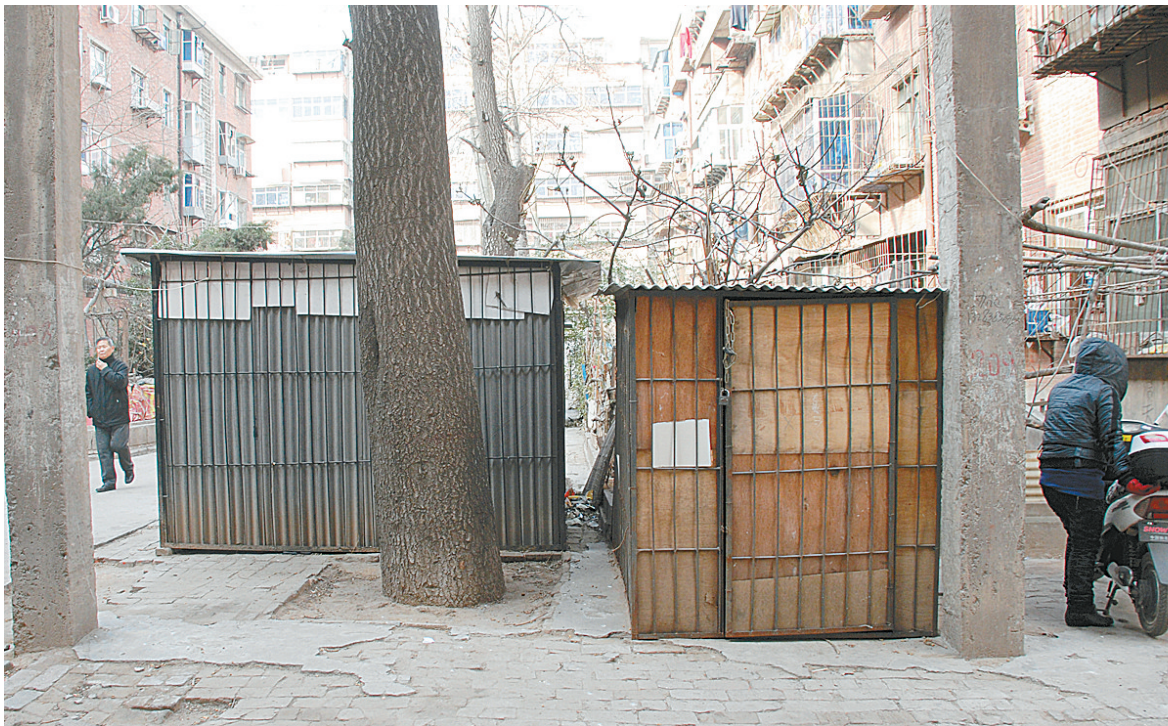
随处可见的铁皮房挡住了消防通道,影响邻里关系。

“只要发现居民违章建造铁皮房,我们就下整改通知,但物业公司没有执法权限,不能强拆。”负责国棉五厂生活区物业管理的豫欣物业公司负责人表示。随后,记者联系到棉纺路办事处执法中队,工作人员表示,他们只能对街道上违章建筑进行处理,生活区的违章铁皮房理应由物业公司处理,此事他们将再次向中原区执法局反映。