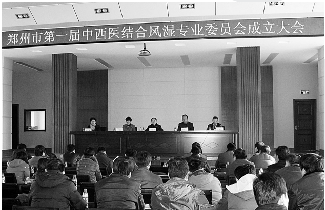
郑州市第一届中西医结合风湿专业委员会成立大会