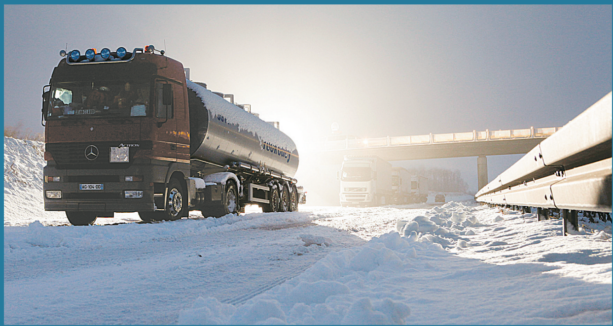
上图 1月10日,在德国北部的居茨科,几辆卡车被困在20号高速公路上。德国北部地区9日和10日普降大雪,梅前州、石荷州等地的铁路、公路交通受到严重影响。