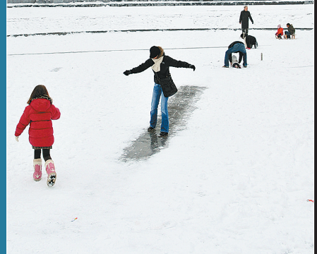
下图 1月10日,在英国东南部的博迪亚姆,行人沿着冰封的护城河行走。寒冷和冰雪天气继续影响英国的交通和百姓生活,10日晚英国各大机场上百个航班被迫取消,全国铁路交通部分中断。均据新华社