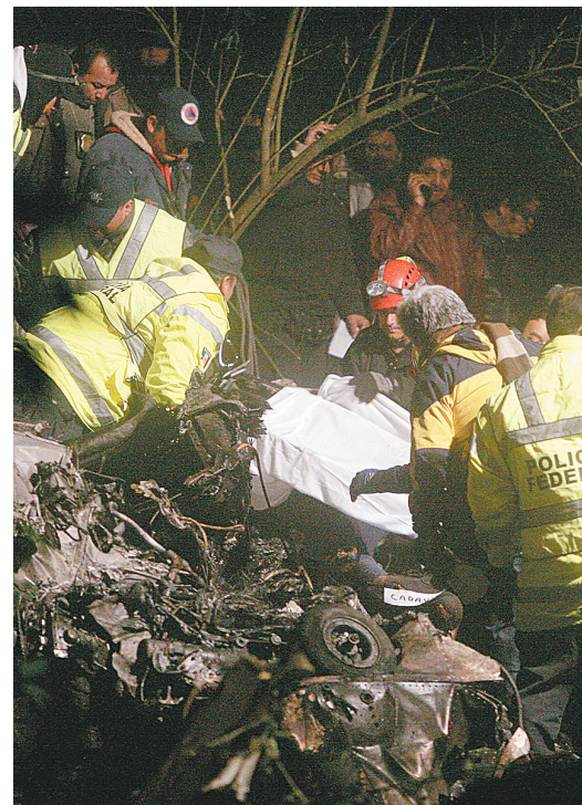
1月10日,在墨西哥首都墨西哥城郊区,搜救人员在直升机坠毁地点清理现场。