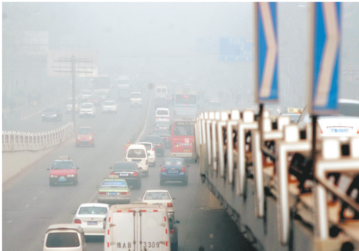
昨日,浓雾一直笼罩着绿城,给全市的交通和市民生活带来了不便。记者在金水立交桥上看到,桥段能见度较低,车辆行驶缓慢。据省气象台预报,今天全省多云到阴天,凌晨到上午全省大部分地区有雾。雾天空气质量较差,市民应减少外出,司机驾车要减速慢行,避免事故发生。