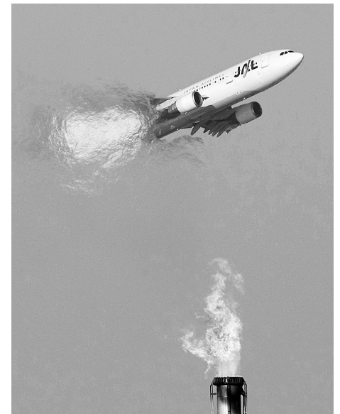
1月19日,在东京,一架日本航空公司的班机从一个工厂上方飞过。