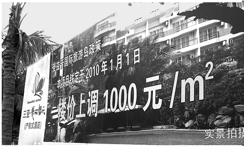
这是2009年12月16日在三亚市区拍摄的某楼盘广告牌。

近半个月来,海南房地产市场快速升温。记者发现,海南楼市的“狂热”背后,主要是外地购房者“非理性”抢购跟风。很多内地购房者一下飞机,就拖着行李箱前来购房,而且一买就是几套。一楼盘财务人员摇头说:“买白菜还要挑选一下呢,买房连选都不选,一买就是好几套。”