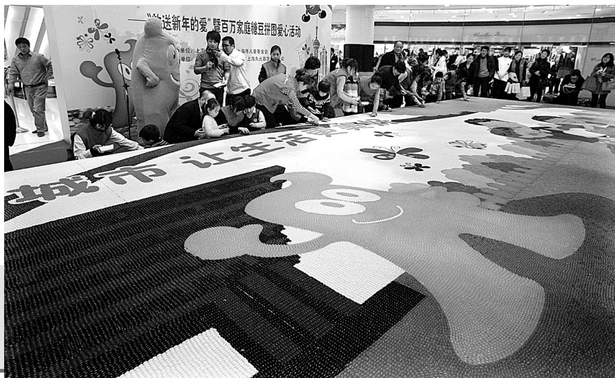
世界最大糖豆拼图亮相上海迎世博,这幅爱心糖豆拼图长12米,宽4米,共使用了800公斤、约80万颗义卖糖豆。

据新华社电 21日是中国2010年上海世界博览会开幕倒计时100天。记者从上海世博会事务协调局获悉,目前已有数十个国家的在任国家元首或政府首脑“预订”了2010年世博之旅,更有大批已卸任或退休的高官计划前来。作为中国第一次举办的综合类世博会,上海世博会不仅引发了普通民众的广泛兴趣,同样让世界政要为之心动、为之倾注。