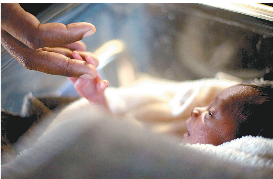
1月20日,在海地首都太子港,一名男子触摸自己刚出生三天的孩子的小手。

表安纳比的葬礼和安葬仪式将于22日在突尼斯举行,联合国负责维和行动的副秘书长勒罗伊将代表秘书长出席。21日,联海团副团长达科斯塔的悼念仪式将在巴西举行,联合国负责维和后勤支持的副秘书长马尔科拉将前往参加。 此外,内西尔基说,19日又有4名幸存者被国际救援队从废墟中救出,使得被救出的地震幸存者总数达121人。