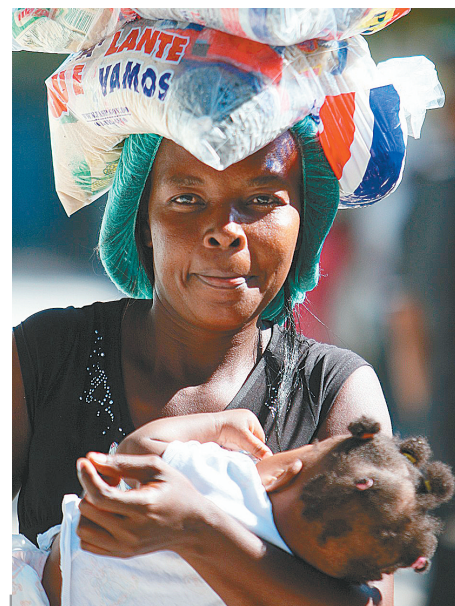
1月20日,海地民众在首都太子港领取救援物资。