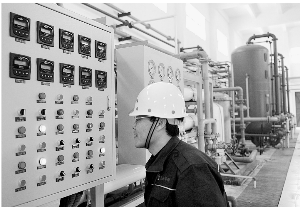
1月27日,江苏省连云港市首座垃圾焚烧发电厂顺利完成首次点火调试。该电厂总投资2.5亿元人民币,设计日处理生活垃圾800吨,年上网电量近1亿千瓦时,电厂一号机组预计今年4月底正式并网发电。

按照部署,今年,我省将以大项目为支撑,以产业集聚区为载体,以乡村旅游为突破,推动产业转型升级,不断提升旅游业市场化、规模化和国际化水平,努力把我省打造成全国一流、世界知名的旅游目的地。我省确定的2010年旅游业主要指标包括:接待入境旅游者145万人次,旅游创汇5亿美元,同比增长15%以上。全年完成旅游项目投资超过200亿元、项目招商引资签订合同金额超过200亿元,扶持100个特色旅游村和10000户“农家乐”发展乡村旅游,力争提供5万个农村就业岗位。