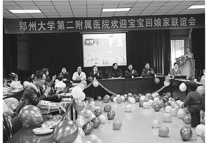
郑大二附院日前举办试管婴儿回“娘家”新春联谊会,近50名“试管婴儿”小朋友们欢聚一堂,载歌载舞。