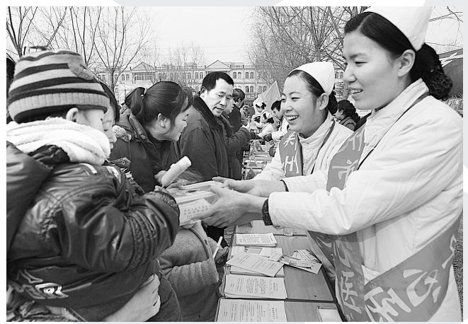
市二院积极响应上级号召,为300名困难职工、农民工开展节前健康体检,确保他们过上一个健康年。