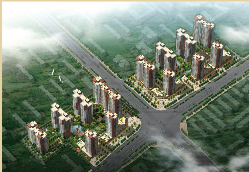
A-1, A-2 鸟瞰图

依据《中华人民共和国城乡规划法》及《河南省城市规划公示制度》有关规定, 为确保该规划工作的顺利实施, 维护全社会对城市规划的知情权与监督权, 使城市规划更加科学, 合理和规范, 保证城市建设的健康运行, 特进行修建性详细规划的公示, 欢迎社会各界对该项目的规划提出宝贵的意见和建议。联系电话: 67188539 (郑州市城乡规划局信访处) 67666508 (郑州市城乡规划局中原分局)