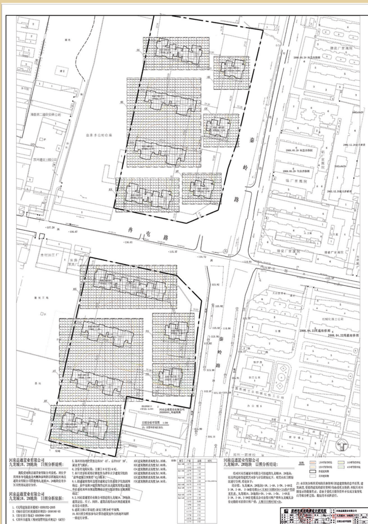
A-1, A-2 日照分析图