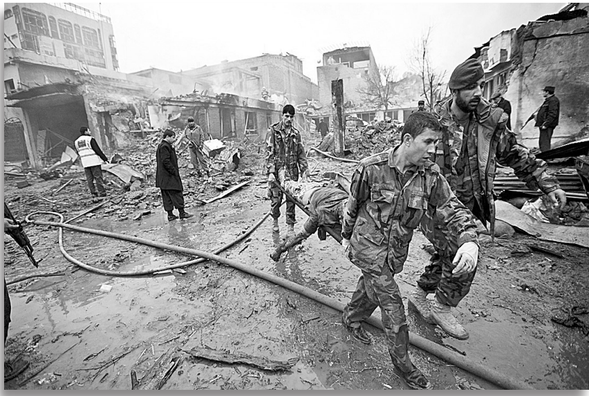
2月26日,在阿富汗首都喀布尔,阿富汗士兵从爆炸现场抬走一名受伤者。

据新华社喀布尔2月26日电 阿富汗首都喀布尔26日清晨发生至少两起剧烈爆炸。警方称,一伙武装分子占据市中心一座商场后与警方发生枪战,已造成12人死亡,其中包括两名警察、3名袭击者和7名平民。