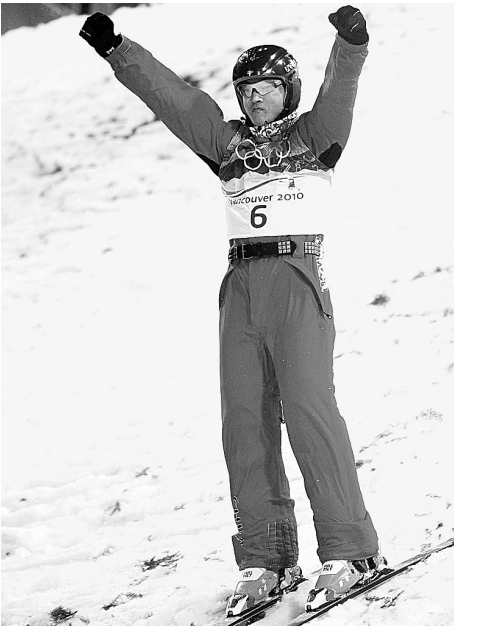
刘忠庆比赛落地后庆祝。

据新华社温哥华2月25日电 参加过三届冬奥会的白俄罗斯选手格列申终于在本届冬奥会空中技巧决赛中摘得铜牌,成绩是242.53分。